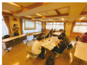
専門職向け研修会の様子