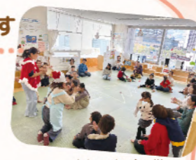
おしゃべり会の様子