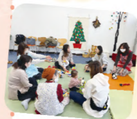
子育て万歳サロンの様子

毎月第2金曜日…区役所1階キッズスペース横 不定期…親子のつどいの広場『ぐらんまのいえ』『シャーロックBABY』、赤ちゃん教室やにしっこひろば、子育てサロンにも出張しています