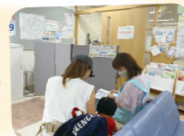
キッズスペース横の相談の様子