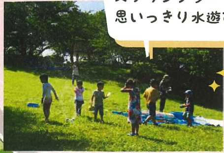
夏はプールや スプリングラワーで 思いっきり水遊び！