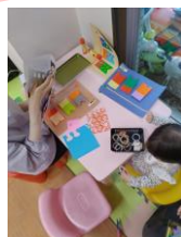
↑こいのぼりのカードを製作している様子♡