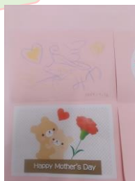
↑母の日のカードがかわいいカードに仕上がりました♡