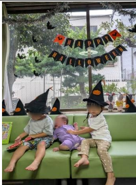
ぐらんまハロウィン