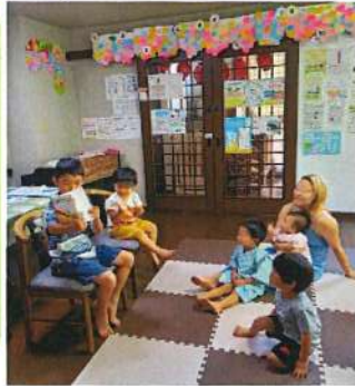
小学生ボランティア