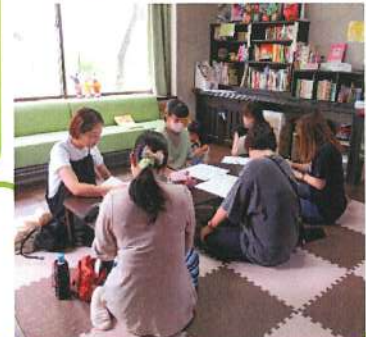
幼稚園ママに 聞いてみよう

～ 利用案内 ～ ☆利用登録をすれば、どなたでも利用できます。 ☆開所日時：火・水・木 10:00~15:00 (12:00~13:00 昼食可) (お盆・年末年始など休館日あり) ☆対 象：横浜市内に居住する、就学前児童（概ね0~3歳） およびその養育者、フシママ ☆利用料：1日1組200円（初回は無料） ☆ご家族を含め発熱、咳、くしゃみ、鼻水などの呼吸器症状、 体調不良がある時はご利用をご遠慮ください。 ☆検温、石鹸で手洗いしてからご利用下さい。 ☆マスク着用は個人の判断にお任せします。 ☆使用済みのオムツなどゴミは各自お持ち帰りください。