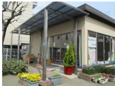
園庭の一角にある支援室 “かんがるーむ”