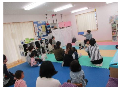
“おはなし会” わらべうたでふれあい遊びも。

【お問い合わせ・お申込み】 横浜市南浅間保育園 (西区育児支援センター園) 横浜市西区南浅間町23-3 ☎045-312-0942