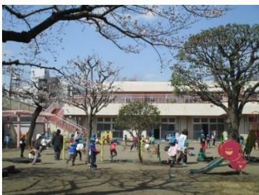
園庭でたくさん遊べます。

利用者の皆様にはご不便をおかけいたしますが、 ご理解とご協力をいただきますようお願いいたします。