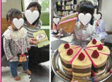
先月のお誕生日会の様子

子サポのひろば預り@ぐらんまのいえ 6月12日(火) 10~12時 6月19日(火) 13~15時 対象:横浜市子育てサポートシステムの 利用会員または両方会員でぐらんま のいえに登録のある未就学児のお子様 お問合せ:045-341-4248 糸賀